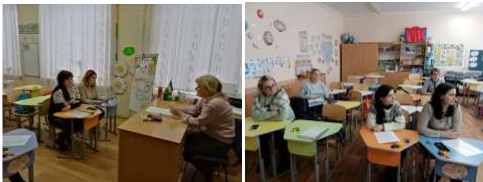
Заняття для учнів 5- х класів «Стоп насилля» або «Неведусь»